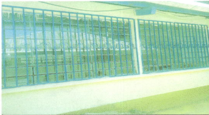
Foto1: balcones colocados